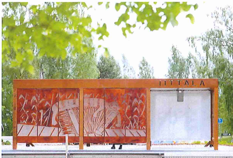
Valokuva: Tanja Lupari